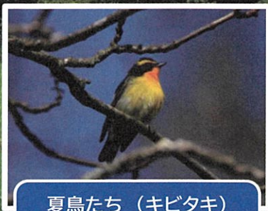
夏鳥たち (キビタキ)