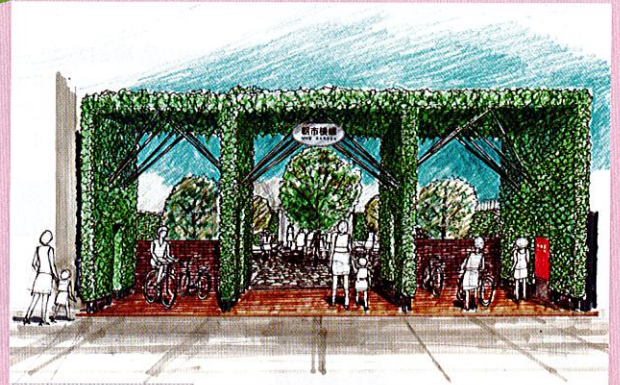
第29回 国土交通大臣賞 チームおんべこ

地域のシンボリックな緑地として人と自然が共生する都市環境の形成、地域の活性化に寄与するプランを募集します。