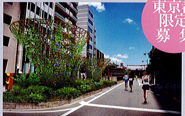
第29回 おもてなしの庭大賞 台東区