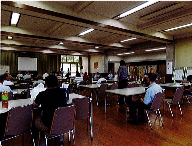
意見交換会の様子

各団体の共通の悩みである「後継者問題」について話題提供と意見交換会も行われ、充実した交流会となりました。