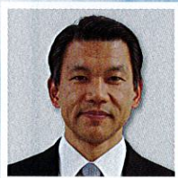
スポーツ庁 民間スポーツ担当 参事官 由良 英雄 氏