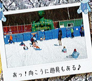
あっ！向こうに遊具もある♪

初参加させて頂きました(笑)お 合同の世帯と少人数で集まる 皆さん、良くてお花見が とても楽しかったです。お花見