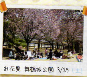
お花見 舞鶴城公園 3/25 (土)

初めに予約をさせて頂きました。皆さんととても優しく、奇跡的にマウウが咲いたのととても楽しいお花見でした(^_^)v 佐知子ママ