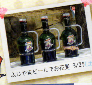
ふじやまビールでお花見 3/25(土)