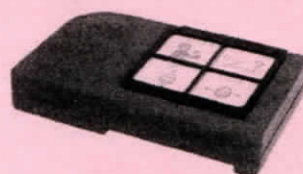
コミュニケーション機器